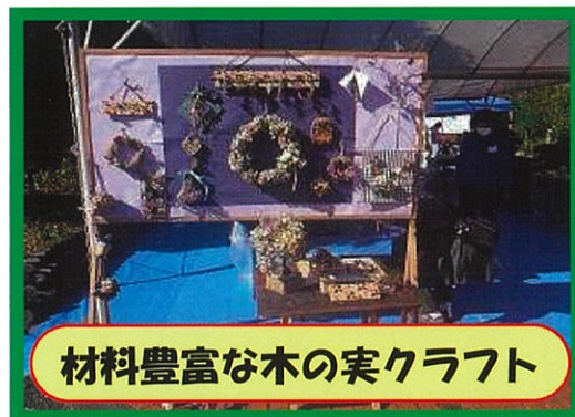
材料豊富な木の実クラフト